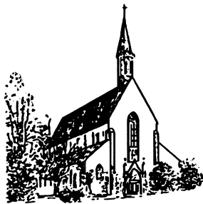
Pfarr- und Wallfahrtskirche