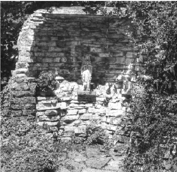
Die Grotte im oberen Riedle an der Kreuzung Talweg / Panoramaweg

Unter Kleindenkmale fällt auch die Art Grotte, die in unserer Gegend meist von Menschenhand erschaffen wurde. So steht eine Marien- Grotte am Ortseingang im Pfarrhof und im oberen Riedle in Höhe des unteren Pumpwerkes. Ein Bild von der Grotte zu Ehren der Mutter Gottes im Pfarrhof Weingarten